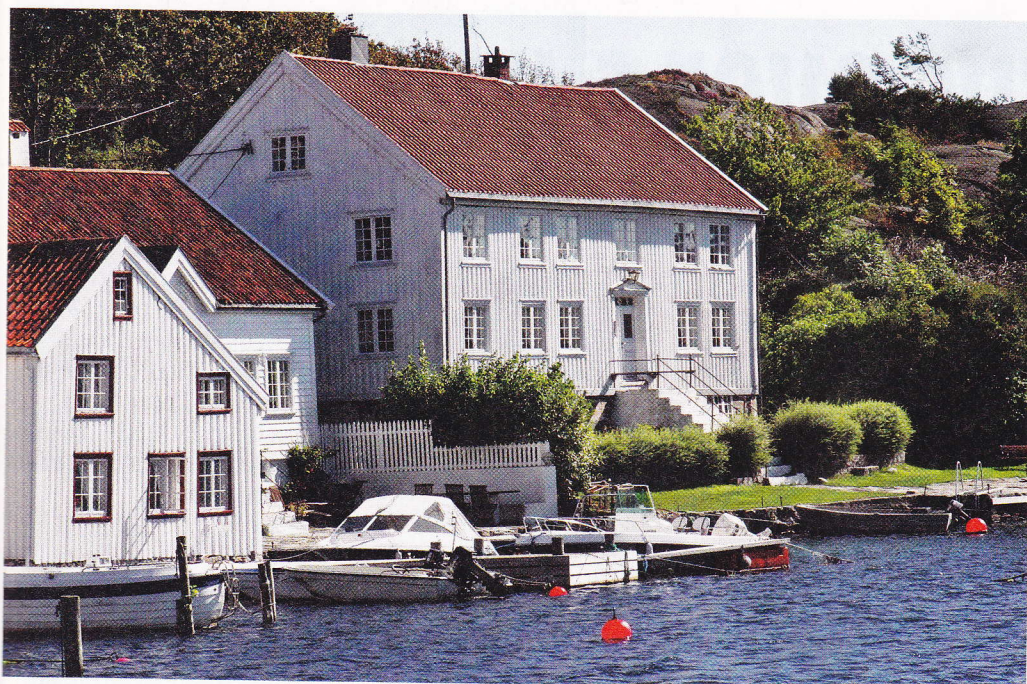
Brekkestø gamle tollstasjon i Lillesand er en av 12 gamle tollstasjoner som nå er fredet av Riksantikvaren.