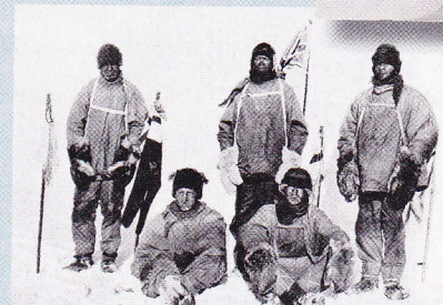
Scott (bak i midten) og hans menn på Sydpolen, 17. januar 1912.

❑ 1918: Den tysktalende delen av det tidligere dobbeltmonarkiet Østerrike-Ungarn erklærer Østerrike for å være republikk.