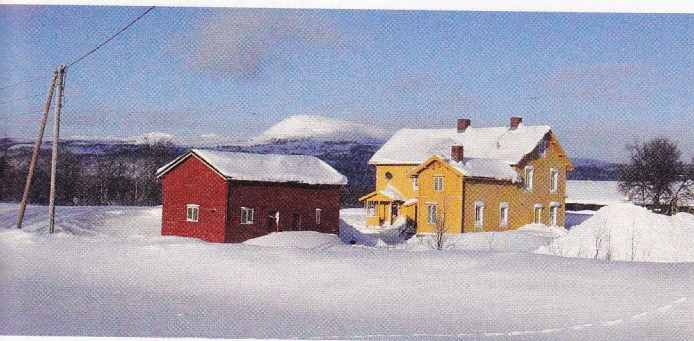
Fra Vauldalen tollstasjon i Røros kommune ble det krevd inn toll fra de som kom over grensen fra Sverige.